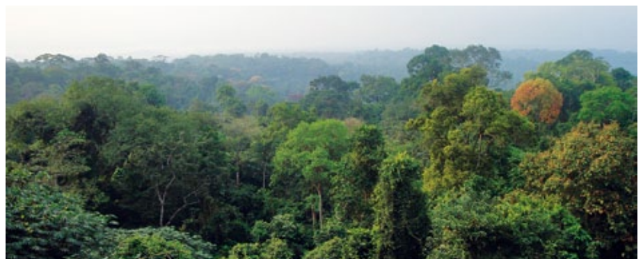
Im Korup Nationalpark lebt ein Viertel aller Primatenarten Afrikas

tagen noch nicht endgültig verhindert. Der Verein hat bereits Spendengelder für ein großes Informationstreffen im Regenwald überwiesen. Dort konnten die Umweltaktivisten die Bevölkerung erstmals über die bedrohlichen Pläne informieren. Viele der Einwohner haben zum ersten Mal erfahren, dass sie ihr Land und den Regenwald für immer an die Palmölfirmen verlieren sollen. Die Menschen waren empört und organisieren nun weiteren Widerstand.