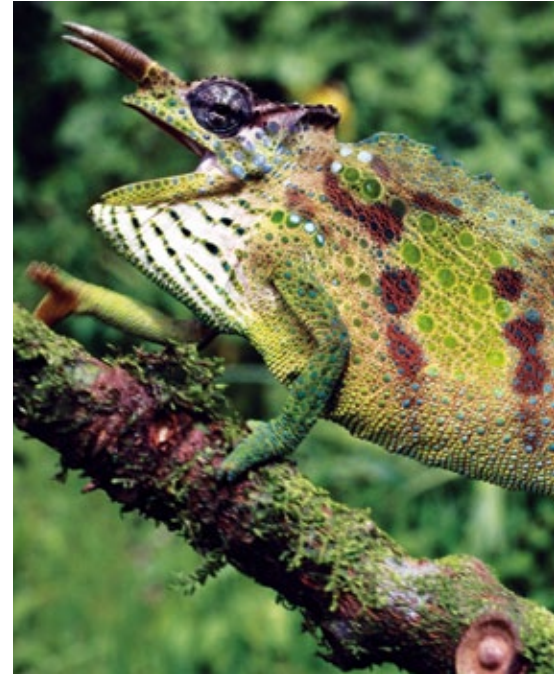
Rund 600 Baum- und Straucharten wurden im Korup gezählt. Das Chamäleon gehört zu den 82 Reptilienarten

Noch gibt es Hoffnung für die Regenwaldbewohner im Südwesten von Kamerun: Das Gericht in Mundemba hat die Rodungen für Palmölplantagen vorerst gestoppt. 70.000 Hektar Urwald wollen die US-Firma Herakles Capital und deren lokale Tochter Sithe Global Sustainable Oils Cameroon für ihre Monokulturen abholzen. Die Plantagen würden das artenreiche Mosaik aus Wald und den traditionellen Kulturen von 45.000 Kleinbauern zerstören. Doch nicht nur die Menschen kämpfen um ihr Überleben – in Gefahr ist auch die zweitgrößte Artenvielfalt Afrikas. Denn das Gebiet grenzt direkt an den Korup Nationalpark. Dort leben die Drills, die höchstgefährdete Affenart des Kontinents, und auch die stark bedrohten Nigeria-Schimpansen, Preuss-Meerkatzen, Stummelaffen und Waldelefanten. Tiere und Pflanzen kennen keine Nationalparkgrenzen. Wird der Wald außerhalb der Schutzzonen abgeholzt, nimmt man ihnen wichtige Wanderkorridore.