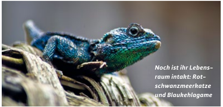
Noch ist ihr Lebensraum intakt: Rotschwanzmeerkatze und Blaukehlgame