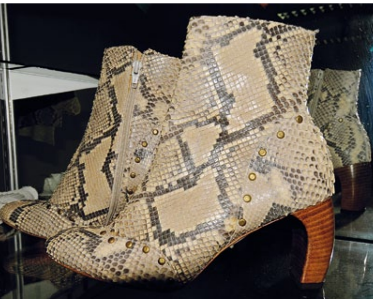
Ein Netzpython könnte 25 Jahre leben und zum Beispiel die Reisfelder der Bauern von Rattenplagen befreien. Wie lange „überlebt“ wohl so ein Stiefel aus seiner Haut?

vor Ort überprüfen, meinen jedoch, dass die Zahl professioneller Jäger gering ist und sich Bauern mit der Jagd nur ein kleines Zubrot verdienen. Es reicht bei Weitem nicht dazu aus, die Familie zu ernähren – bei den Bauern kommt nur ein Bruchteil des Verkaufspreises an.