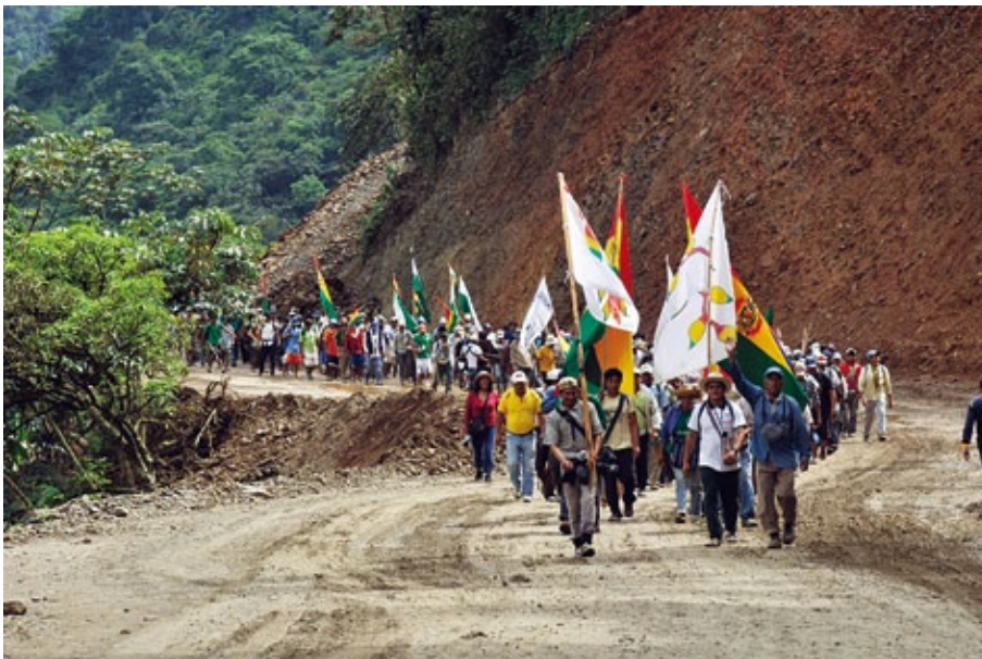
Kein Weg war den Menschen zu steil: Ihre Heimat liegt zwischen 180 und 3.000 Meter

Ihre Heimat gehört zu den magischen Orten im Amazonasgebiet. Denn der Nationalpark Isiboro Sécuré ist einer der artenreichsten Lebensräume in Bolivien. Der Grund für die noch kaum erforschte Vielfalt ist die besondere Lage: Zwischen den Anden und dem Tiefland des Amazonas konnte sich eine Fülle von Tieren und Pflanzen Lebensräume erobern. Drei indigene Völker haben dort bis heute überlebt – sie nutzen die Waldfrüchte und kennen die Bedeutung jeder Medizinpflanze. Doch plötzlich war alles in