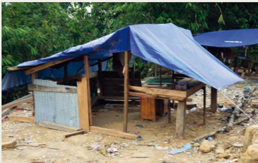
Notdürftig haben sich die Menschen mit Brettern und Plastikplanen neue Unterkünfte gebaut – sie brauchen dringend unsere Hilfe