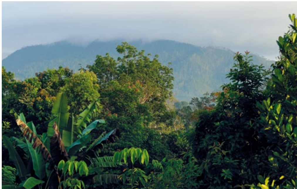
Im Kerinci Seblat Nationalpark auf Sumatra konnten Tiger, Elefanten, Malayenbären, Tapire und mehr als 4.000 Pflanzenarten überleben. Er gehört zum UNESCO-Welterbe

Rettet den Regenwald und Robin Wood machen Unilever mitverantwortlich für die fortgesetzten illegalen Abholzungen und Menschenrechtsverletzungen seines Palmöl-Lieferanten.