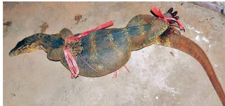
Netzpythons werden bis zu neun Meter lang und 100 Kilos schwer – aber dem Menschen sind sie hilflos ausgeliefert. Pythons und Warane sind wichtig für das Waldökosystem

halten das ökologische Gleichgewicht aufrecht, indem sie die intensive Ausbreitung bestimmter kleinerer Arten verhindern. In ländlichen Regionen sind vor allem die ungiftigen Netzpythons wegen ihres großen Hungers auf Ratten gern gesehene Gäste. Der Bindenwaran übernimmt als Aasfresser in der Natur die Funktion der „Gesundheitspolizei“.