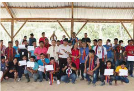
Ihre Ausdauer hat sich ausgezahlt. Riesenerfolg für die indigenen Sápara.

In Ecuador haben die indigenen Sápara die Rechte für ihren Regenwald nach einem monatelangen Rechtsstreit wieder zurückerhalten. Betrüger hatten sich als Interessenvertretung der Indigenen ausgegeben, um sich heimlich als Eigentümer des angestammten Landes der Sápara registrieren zu lassen. So sollte der Weg für die Erdölförderung im Regenwald freigemacht werden, gegen die die Sápara seit Jahren erfolgreich Widerstand leisten. Als der Betrug aufflog, gab das Verfassungsgericht die Landrechte wieder an die legitime Vereinigung der Indigenen zurück. Doch aufgrund rechtlicher und verwaltungstechnischer Lücken mussten die Sápara, die bei ihrem Kampf gegen die Behörden von Rettet den Regenwald unterstützt wurden, weiter bangen. Erst Monate später wurde das Gebiet wieder endgültig auf ihren Namen eingetragen.