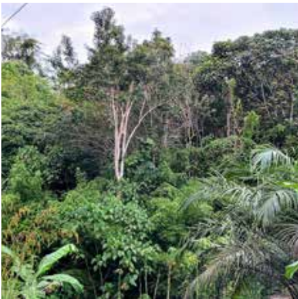
Besonders viele noch nicht erforschte Baumarten finden sich in den Regenwäldern.