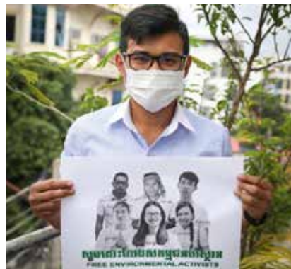
Gefährliche Arbeit für den Regenwald: Aktivisten werden vermisst oder ohne Grund verhaftet.