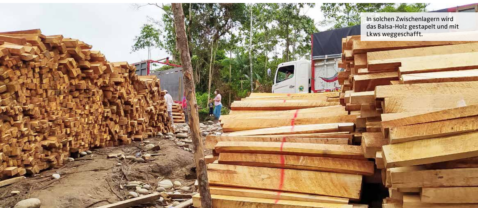
In solchen Zwischenlagern wird das Balsa-Holz gestapelt und mit Lkws weggeschafft.

Mit Motorsägen werden die Stämme meist vor Ort zu Kanthölzern zerkleinert und schwimmend oder per Kanu bis zur nächsten Landstraße transportiert. In den unerschlossenen Regenwaldgebieten sind die Flüsse die Verkehrsadern, und Balsa ist das leichteste Holz der Welt - es wiegt etwa so viel wie Kork. Mit zumeist gefälschten Transportgenehmigungen ►