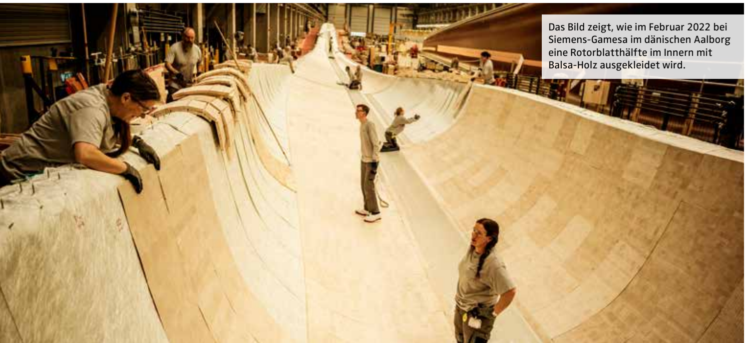
Das Bild zeigt, wie im Februar 2022 bei Siemens-Gamesa im dänischen Aalborg eine Rotorblatthälfte im Innern mit Balsa-Holz ausgekleidet wird.

Konzern Siemens-Gamesa in seinen neuen Werken in den Häfen von Aalborg in Dänemark, im französischen Le Havre und im britischen Hull her. Dazu werden Lagen von Glasfaser und Balsa-Holz in einer 81 Meter langen Form ausgelegt und dann mit Epoxidharzen verklebt. Knapp zwei Tonnen Balsa werden in jeden Flügel verbaut. Bei drei Blättern pro Windkraftanlage sind das 40 Kubikmeter Holz, was mindestens 40 Balsa-Bäumen entspricht. Bald sollen noch größere, 108 Meter lange Rotorblätter für die nächste Generation von Offshore-Mühlen dazukommen.