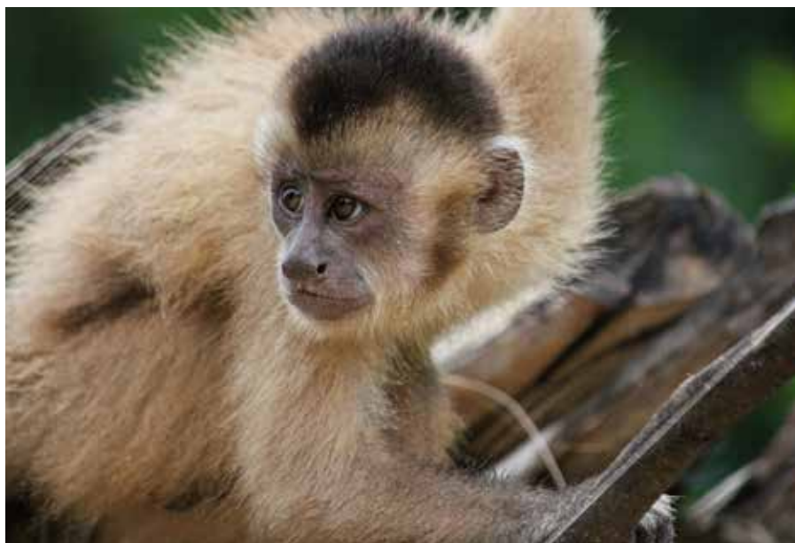
Im Territorium der Indigenen hat der Kaapor-Kapuzineraffe einen seiner letzten Lebensräume.

Spenden Sie über das Formular auf der Heft-Rückseite oder online: regenwald.org/rr067