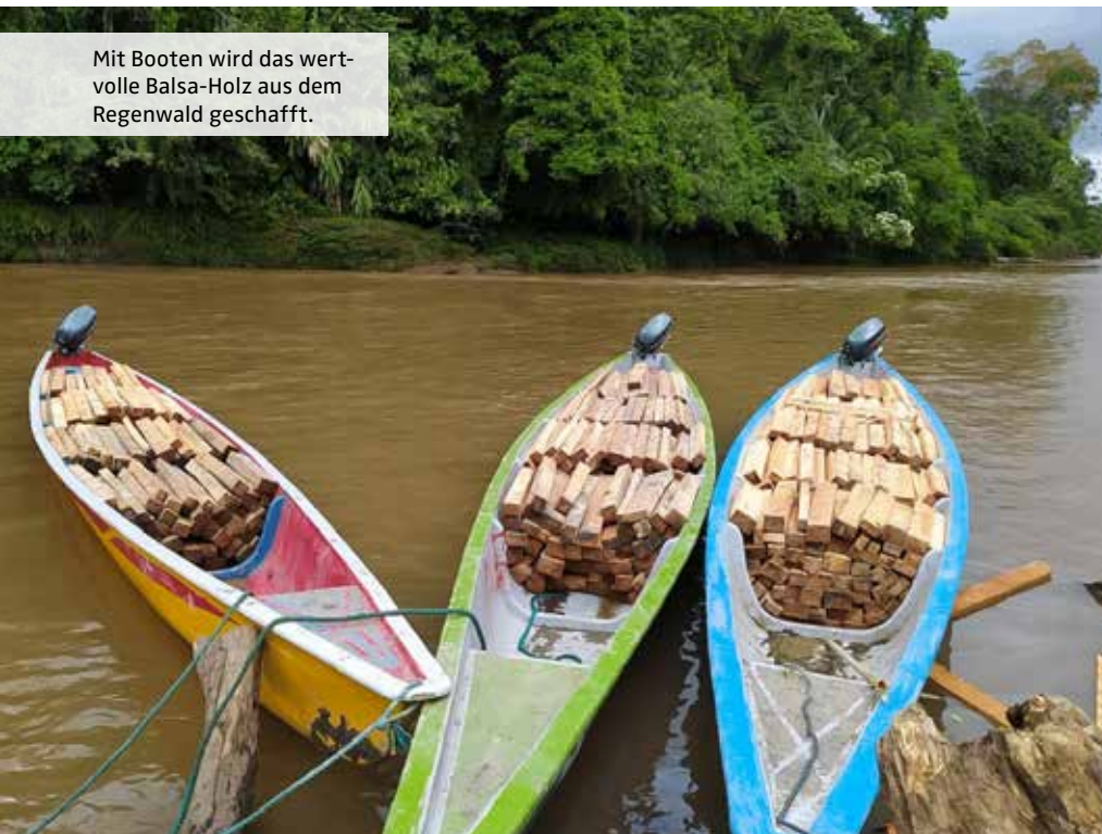
Mit Booten wird das wertvolle Balsa-Holz aus dem Regenwald geschafft.

Rettet den Regenwald fordert die Windbranche und ihre Lieferanten auf, Balsa-Holz aus Raubbau und illegaler Regenwaldabholzung unverzüglich und effektiv auszuschließen. Außerdem müssen sie lückenlose Transparenz über die Herkunft, Lieferwege und verbrauchten Balsa-Mengen schaffen. Neben der Wirtschaft ist auch die Politik bei uns und in Ecuador gefragt, einen erneuten Ansturm auf Balsa-Holz zu verhindern. ■